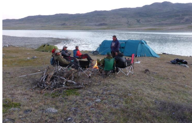
Gruppe med Mylla-fiskere på Grønland